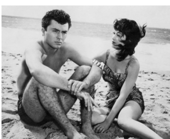
1957 TIJUANA, CITÉ CORROMPUE (Tijuana Story) de Leslie Kardos avec Joy Stoner