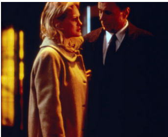
1993 LE JOUR DU JUGEMENT (Judgment Day) de Bobby Roth avec Beverly D'Angelo