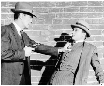
1959 LE GANG ROUGE (The Purple Gang) de Frank McDonald avec Barry Sullivan