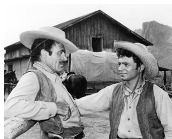
1956 TERRE SANS PARDON (Three Violent People) de Rudolph Maté avec Gilbert Roland