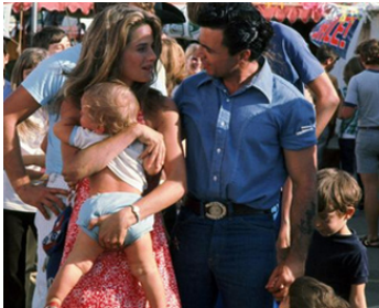
1972 CORKY (Corky) de Leonard Horn avec Charlotte Rampling