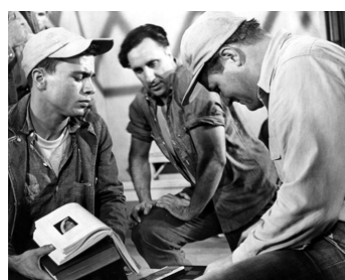
1958 LA RÉVOLTE EST POUR MINUIT de R. G. Springsteen avec Timothy Carey