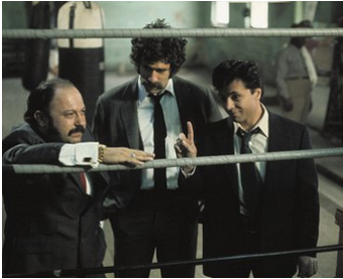
1974 LES CASSEURS DE GANG (Busting) de Peter Hyams avec Allen Garfield, E. Gould