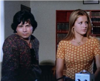
1972 LE CORIACE (Un Uomo dalla pelle dura) de Franco Prosperi avec Catherine Spaak