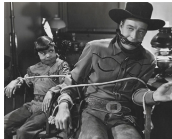
1945 LE SHÉRIFF DE LOREDO (Marshall of Loredo) de R. G. Springsteen avec Bill Elliott