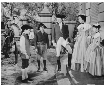
1952 LE TRÉSOR DU GUATEMALA (Treasure...) de D. Daves avec G. MacReady, A. Bancroft