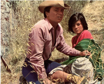
1969 WILLIE BOY (Willie Boy) d'Abraham Polonsky avec Katherine Ross