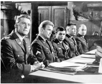
1961 VILLE SANS PITIÉ (Town Without Pity) de G. Reinhardt avec K. Douglas, R. Jaeckel