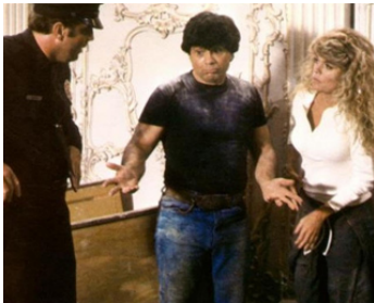
1980 COAST TO COAST de Joseph Sargent avec Dyan Cannon