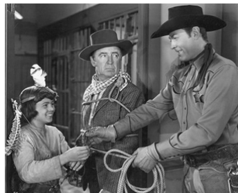
1947 MARSHAL OF CRIPPLE CREEK de R. G. Springsteen avec Herman Hack, Allan Lane