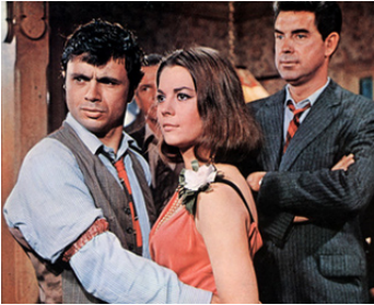
1966 PROPRIÉTÉ INTERDITE (This Property is condemned) de S. Pollack avec Natalie Wood