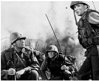
1959 LA GLOIRE ET LA PEUR (Pork Chop Hill) de Lewis Milestone avec Gregory Peck