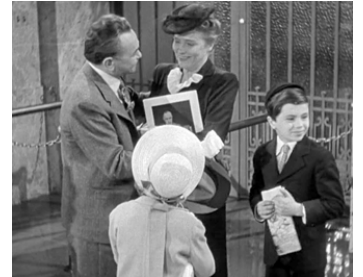
1944 LA FEMME AU PORTRAIT (The Woman in the Window) de F. Lang avec E. G. Robinson