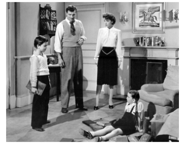
1943 L'ANGE PERDU (Lost Angel) de R. Rowland avec James Craig, Marsha Hunt, M. O'Brien