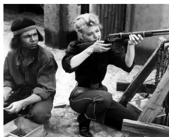
1952 LE SIGNAL DE L'ATTAQUE (Apache War Smoke) d'Harold F. Kress avec Barbara Ruick