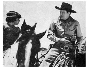
1945 CAVALCADE VERS L'OUEST (Wagon Wheels Westward) de R. G. Springsteen avec Bill Elliott