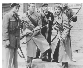
1957 LES RÉVOLTÉS DE BUDAPEST d'Harmon Jones avec Michael Mills, Violet Rensing