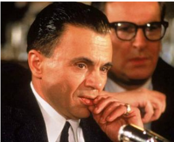
1983 KENNEDY CONTRE HOFFA (Blood Feud) de Mike Newell