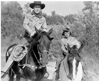
1946 CONQUEST OF CHEYENNE de R. G. Springsteen avec Sam Elliott