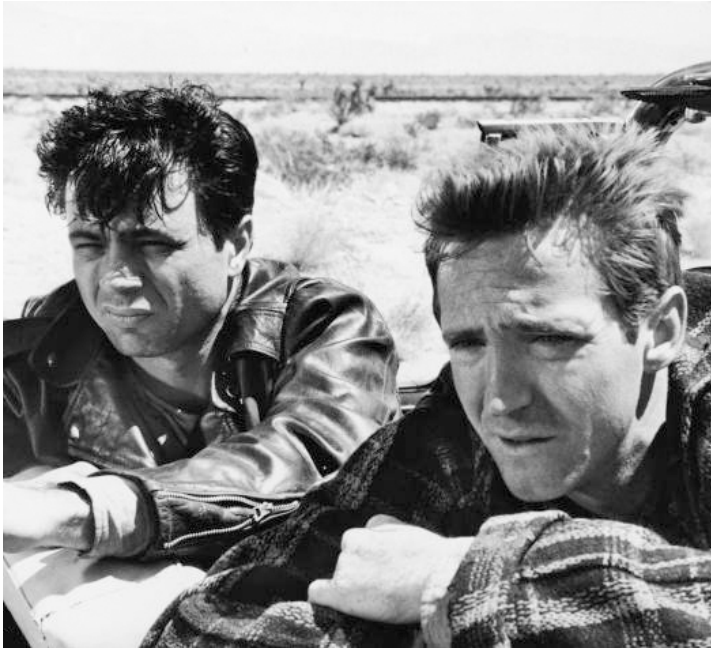
1967 DE SANG-FROID (In Cold Blood) de Richard Brooks avec Scott Wilson