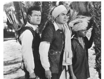
1950 LA ROSE NOIRE (The Black Rose) d'Henry Hathaway avec Jack Hawkins, Tyrone Power