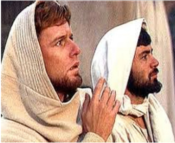
1964 LA PLUS GRANDE HISTOIRE JAMAIS CONTÉE de G. Stevens avec R. McDowall