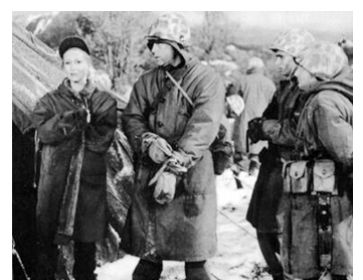
1959 LES FEUX DE LA BATAILLE (Battle Flame) de R. G. Springsteen avec E. Edwards, S. Brady