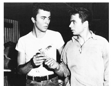
1956 LA TERREUR DES BAS-FONDS (Rumble on the Docks) de F. Sears avec James Darren