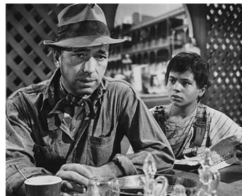
1948 LE TRÉSOR DE LA SIERRA MADRE de John Huston avec Humphrey Bogart