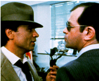
1981 JOE DANCER, Le Trou Noir (The Big Black Pill) de Reza Badiyi avec Edward Wubter