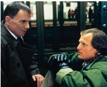
1995 MONEY TRAIN (Money Train) de Joseph Ruben avec Woody Harrelson