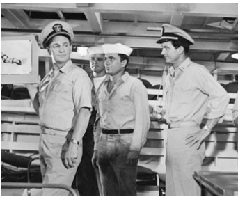
1962 PATROUILLEUR 109 (PT 109) de Leslie H. Martinson avec James Gregory, Cliff Robertson